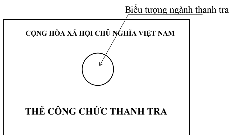
Hình 1. Mặt trước thẻ công chức thanh tra

Giữa hai dòng là biểu tượng ngành thanh tra, đường kính 24mm.