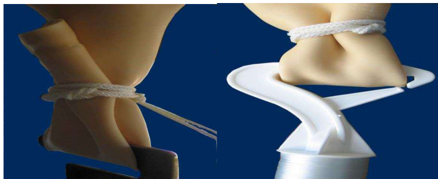
Hình 3: Cổ bóng được buộc vào mỏ tời

- Buộc chặt cổ bóng bằng dây mềm, thắt nút đoạn dây thừa rồi nhẹ nhàng tháo cổ bóng ra khỏi chén cân, móc dây vào chốt cố định dưới sàn bơm bóng; xếp gọn cổ bóng rồi gấp đôi lên lần nữa, buộc chặt; dùng mỏ tời luồn vào khe vừa gấp đôi ở cổ bóng (hình 3);