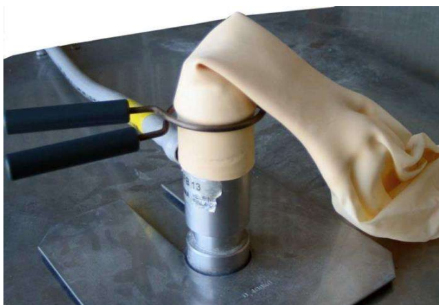
Hình 1: Cổ bóng được lồng vào chén cân