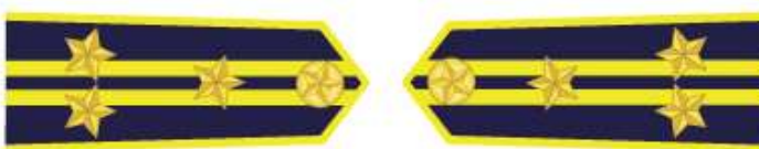
Phó Trưởng phòng thuộc Cục, Phó Chi cục trưởng Chi cục Kiểm ngư Vùng, Phó Chi đội trưởng Chi đội Kiểm ngư và các chức danh tương đương