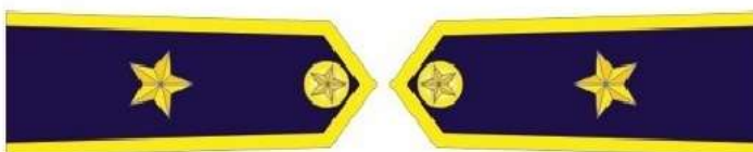
Phó Cục trưởng