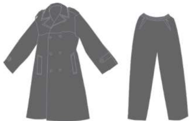
Bộ quần, áo mưa