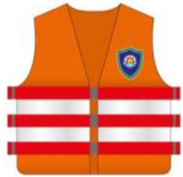
áo phao cá nhân