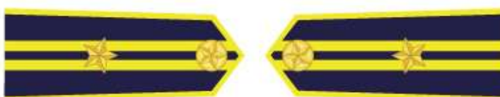
Phó Trưởng phòng thuộc Chi cục Vùng, Phó Trạm trưởng Trạm kiểm ngư,