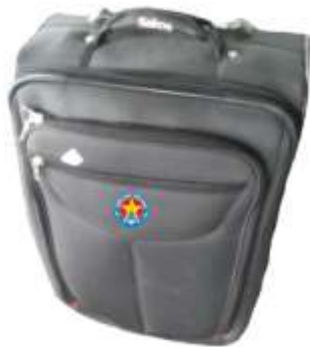
Va li kéo