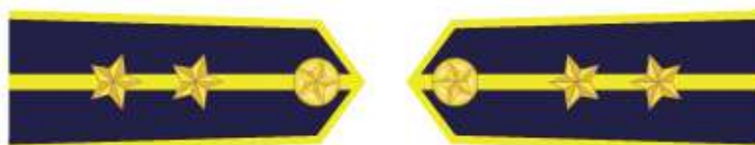
Kiểm ngư viên trung cấp