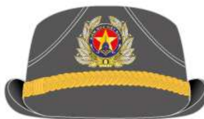
Mũ mềm nữ