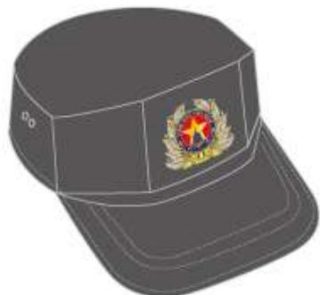
Mũ mềm nam