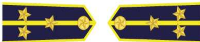
Kiểm ngư viên