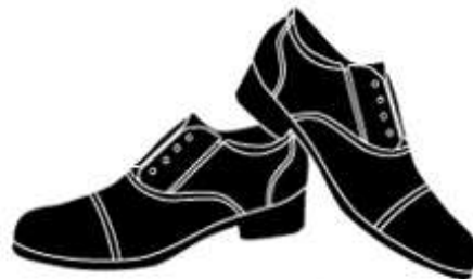
Giày da nam