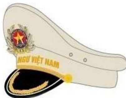
Mũ lễ phục