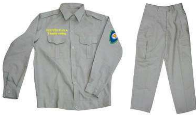
Quần, áo bảo hộ lao động