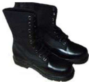
Giày công tác trên tàu