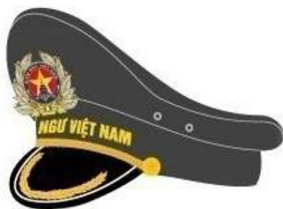
Mũ kê pi