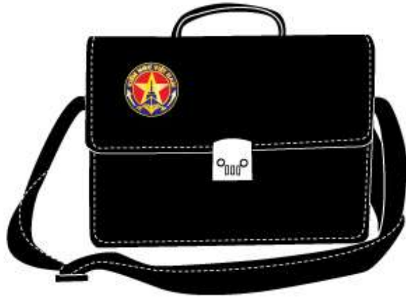
Cặp công tác