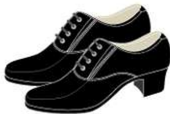
Giày da nữ