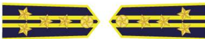
Trưởng phòng thuộc Cục, Chi cục trưởng Chi cục Kiểm ngư Vùng, Chi đội trưởng Chi đội Kiểm ngư và các chức danh tương đương