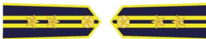
Trưởng phòng thuộc Chi cục Vùng, Trạm trưởng Trạm kiểm ngư, Đội trưởng đội tàu và các chức danh tương đương