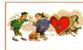
TRẺ EM CÓ QUYỀN ĐƯỢC BẢO VỆ KHỎI BẠO HÀNH VÀ NGƯỢC ĐÁI VỀ CẢ THỂ CHẤT VÀ TINH THẦN