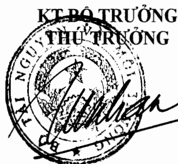
Võ Tuấn Nhân